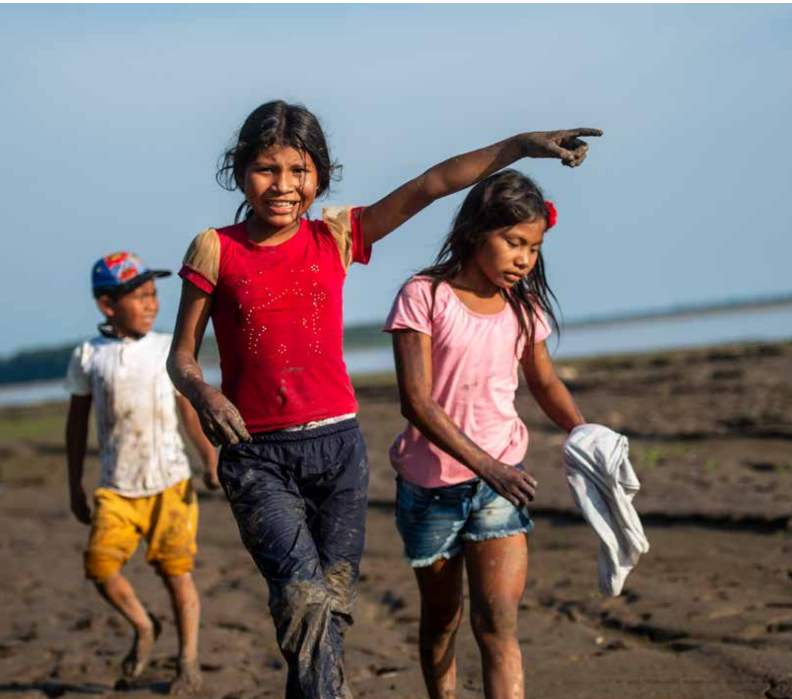
Kinder im kolumbianischen Santa Sofia spielen am Ufer des Amazonas-Flusses.

Waldvernichtung, ferner Aufforstung und nachhaltige Forstwirtschaft sowie eine Kehrtwende vor allem der industrialisierten Landwirtschaft hin zu ökologischem Landbau.